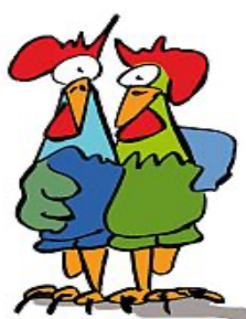
Miteinander debattieren !