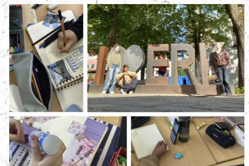
Erkundung von Erkelenz und erste Scrapbook-Entwürfe