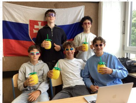
Spaß darf im Projekt auch nicht fehlen!