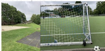
Spiel- und Sportstätten in Erkelenz