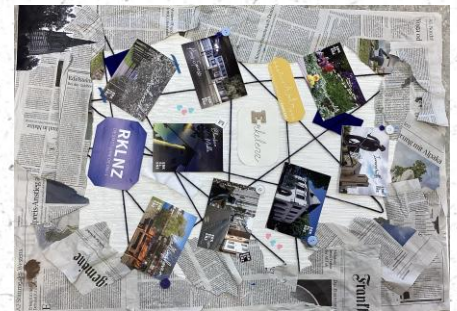
Erste Artworks werden erstellt