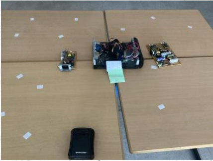
Die Bombe – Ein Teil des Escape Rooms

Die Professorin Rina Auerbauch ist das Unmögliche gelungen: Zeitreisen. Doch dadurch ändert sich der Lauf der Zeit. Ihr geliebtes Erkelenz ist kulturell und finanziell am Ende. Vier oder fünf historische Personen müssen Erkelenz vor dem Untergang retten.