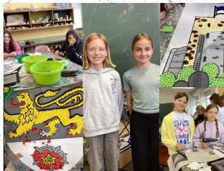
Schüler bei der Bearbeitung von Maibildern

Auch beim Comic-Projekt tut sich einiges!