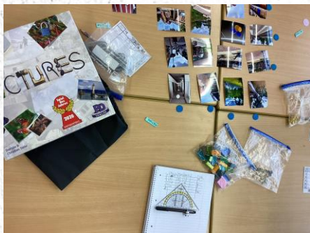
Das fertige Spiel Pictures