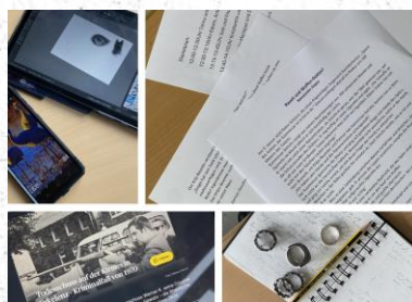
Prozess des Schreibens...

interessiert am Schreiben, sondern auch innerhalb deren Freizeit. Am Mittwoch erarbeiteten sie, was Kurzgeschichten sind, und recherchierten über fesselnde Fälle, worüber sie schreiben wollten. Spätestens am Donnerstag ging es für die Schüler*innen los zwei bis sieben seitenlange Geschichten zu verfassen.