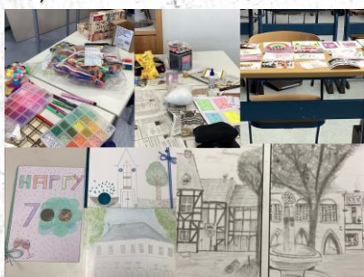
Bunt gehts zu in der Postkartenwerkstatt