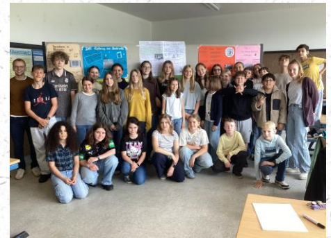
Die Redaktion der rasenden Reporter