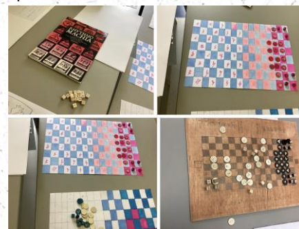
Gestaltung der Schachspiele