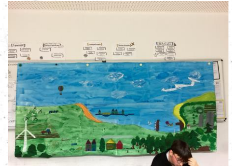
Künstlerische Gestaltung von Zukunftsideen