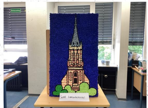
Auch die Sankt Lambertus Kirche war ein beliebtes Motiv