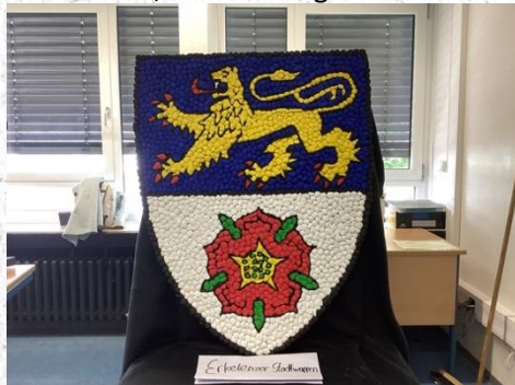
Das Stadtwappen wurde vom Bürgermeister gekauft

Am Samstag fand im Flur im ersten Stock die Versteigerung der Maibilder statt. Versteigert wurden die Burg, das alte Rathaus, das Stadtwappen und die Sankt Lambertus Kirche. Einer der Schülerinnen aus der 5d sagte uns: „Die Arbeit war zwar schwer, da wir viel Geduld und Tatendrang brauchten. Auch die dunkle Farbe von den Händen zu bekommen, war ein langer Prozess.“