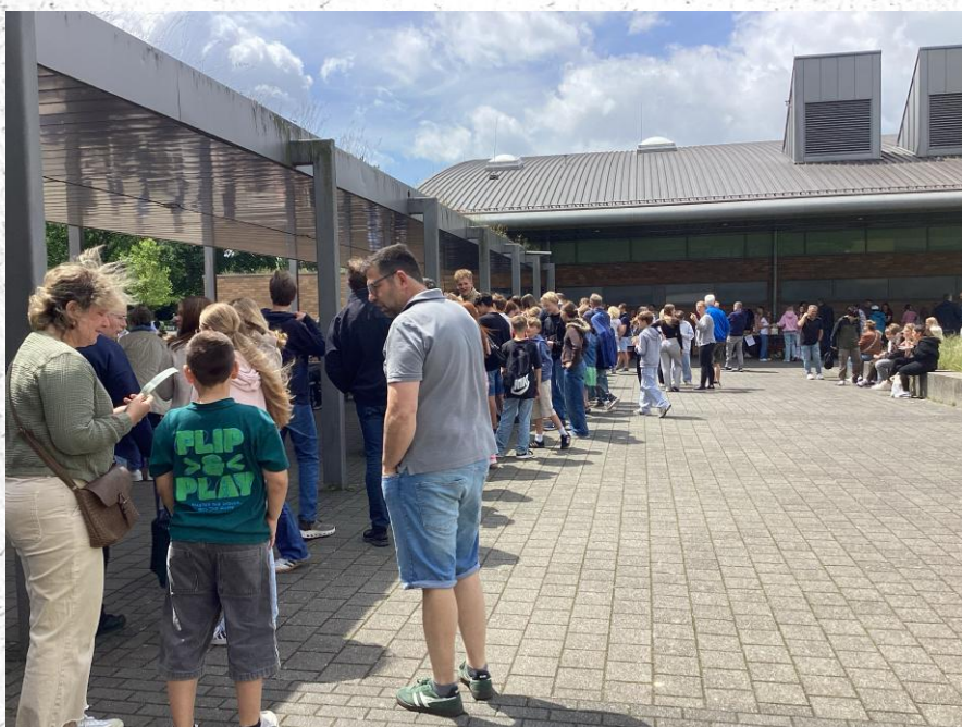
Lange Schlange für den Döner

Ob Döner, Zuckerwatte oder Kuchen - hier beim Schulfest des CBG gibt es kulinarisch viel zu bieten.