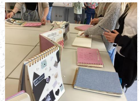
Scrapbooks zum Anschauen!

„Die Leute gucken es sich einfach an und man muss nicht so viel erklären“, sagte eine Schülerin. Auch den anderen machte es Spaß, ihre persönlichen Scrapbooks anderen zu zeigen. Die Besucher schauten sich die Scrapbooks sehr interessiert an, blieben stehen und blätterten durch die einzelnen Scrapbooks, welche schöne, selbstgeschossene Bilder, einzelne Texte und kleine Sticker beinhalteten. Die schönen bunten Bilder und gute Stimmung sorgten dafür, dass immer mehr Besucher in den Projektraum kamen. Den Schülerinnen und Schülern machte das Projekt und das Erstellen der Scrapbooks viel Spaß. Einige machten dies zum ersten Mal und es war sehr spannend für sie.